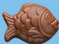
Chocolat au lait 36% de cacao