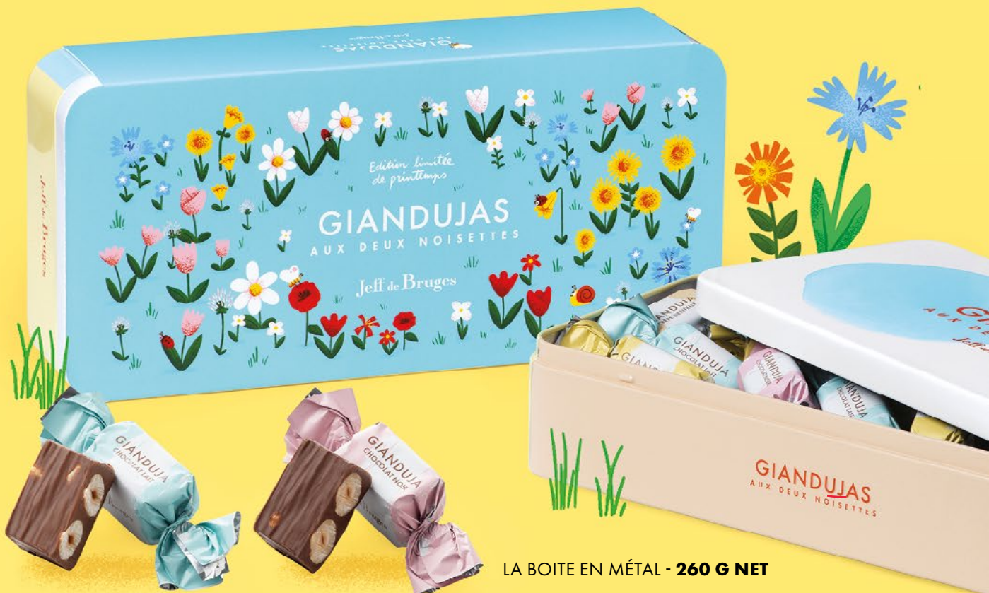
Chocolat au lait

Imaginez notre fameux gianduja dans lequel sont plongées non pas une mais deux noisettes entières. Voici l'alliance exquise du croquant et du fondant !