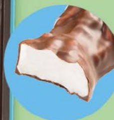
Un cœur tendre en guimauve enrobé de chocolat au lait

LA BOITE DE 28 LAPINS EN GUIMAUVE ENROBÉS DE CHOCOLAT AU LAIT** - 280 G NET